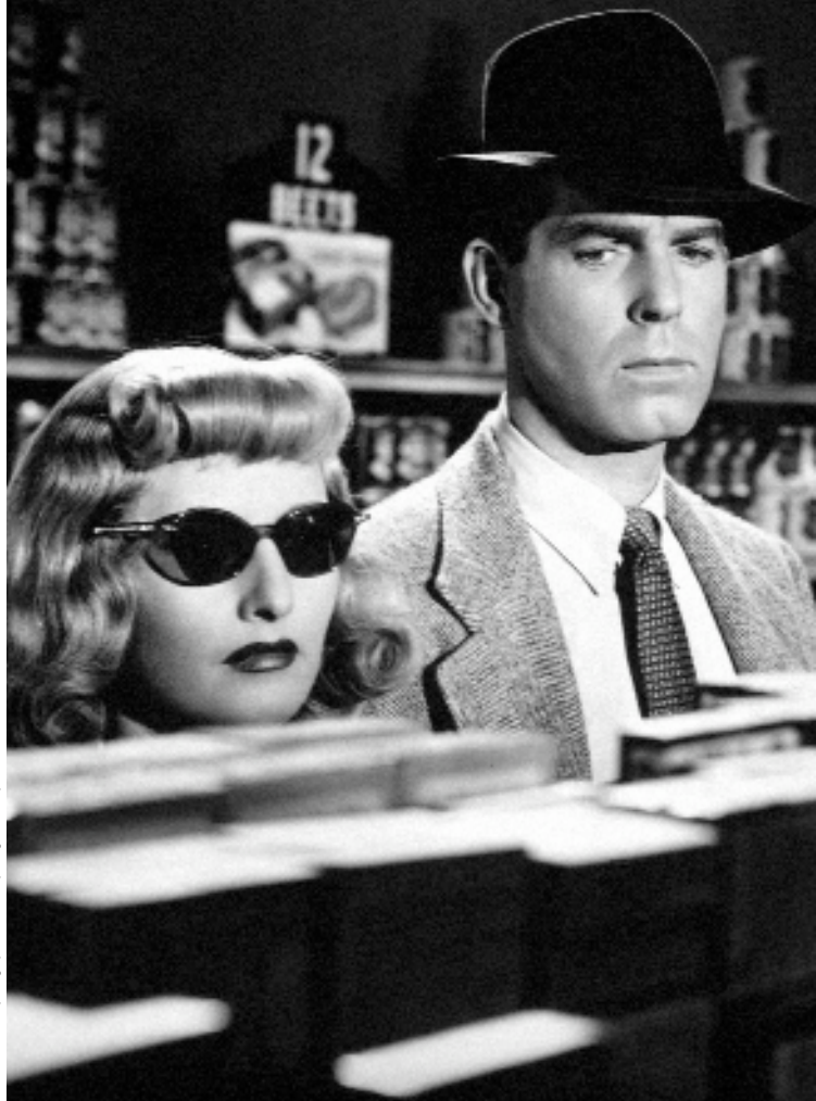
espace graphic carros - dépôt légal 06/09 - photo cour. Tous droits réservés